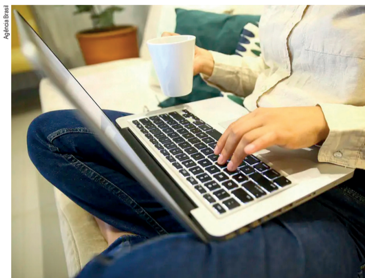
O e-commerce brasileiro mais do que quintuplicou de tamanho

O MDIC e a Agência Brasileira de Desenvolvimento Industrial (ABDI) desenvolvem o projeto E-commerce.BR para aumentar a adesão de pequenos negócios ao comércio online. A previsão é lançar esse projeto até o fim do ano. A iniciativa pretende melhorar o desempenho financeiro através de soluções inovadoras, sobretudo em regiões onde o comércio eletrônico ainda está tímido. Em termos de fluxo de comércio eletrônico, as transações interestaduais são maiores (62%) do que as que ocorreram dentro do próprio estado (38%).