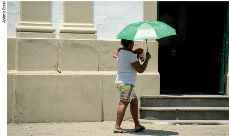
O ano de 2024 já está sendo considerado o mais quente

A situação continua tensa, com o possível futuro do presidente no centro das discussões políticas. A moção de destituição pode marcar um ponto de inflexão para o governo sul-coreano, em meio a um clima de instabilidade crescente.