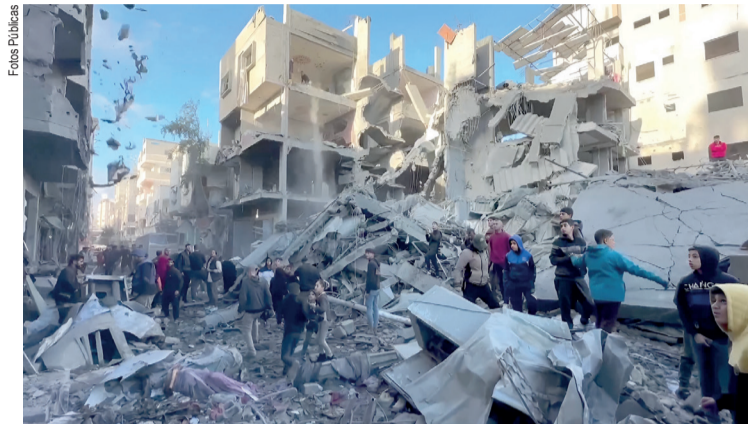
Israel faz ataques aéreos no Iêmen

calada de tensões na região aumenta as preocupações internacionais sobre a estabilidade no Oriente Médio e o impacto humanitário nos países envolvidos.