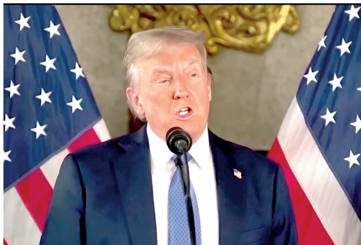
Declarações de Trump geram reações de países

Além dessas propostas, Trump mencionou a intenção de renomear o Golfo do México para "Golfo da América" e sugeriu que os países membros da OTAN aumentem seus gastos com defesa para 5% do PIB, acima da meta atual de 2%. Essas declarações ocorrem a poucas semanas de sua posse, marcada para 20 de janeiro, e têm gerado debates sobre as futuras políticas externas dos Estados Unidos.