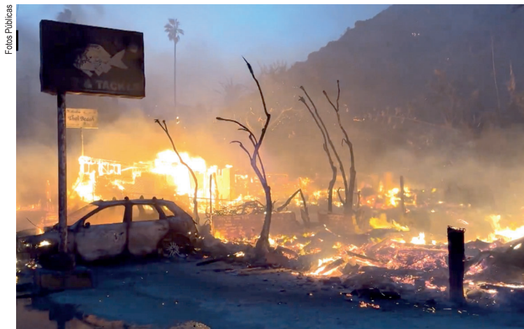
As autoridades locais emitiram ordens de evacuação

A eleição de Aoun é vista como um passo para restaurar a estabilidade no Líbano e melhorar as relações internacionais. No entanto, ele enfrentará grandes desafios, como a reconstrução do país e tensões com Israel, com a comunidade internacional observando seus próximos passos.