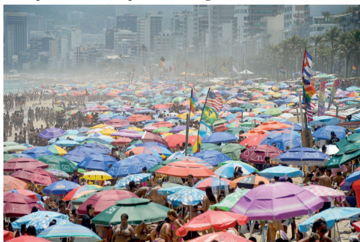
Média global subiu 1,6°C acima do pré-industrial

que o aumento das temperaturas médias globais está associado a eventos climáticos extremos, como ondas de calor, secas e inundações. A superação da meta do Acordo de Paris evidencia a necessidade urgente de ações mais efetivas para reduzir as emissões de gases de efeito estufa e mitigar os efeitos do aquecimento global.