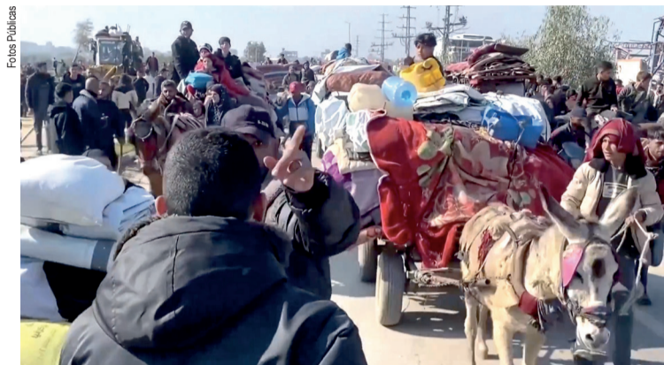
A situação humanitária em Gaza é crítica

A comunidade internacional expressa crescente preocupação com a escalada do conflito. A ONU acusou Israel de genocídio em Gaza, uma alegação que o governo israelense rejeita veementemente. Enquanto isso, líderes de países árabes e organizações de direitos humanos pedem um cessar-fogo imediato e o respeito aos direitos dos civis. No entanto, as perspectivas de uma resolução pacífica permanecem incertas, com ambos os lados mantendo posições firmes.