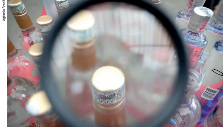
Investigações continuam sobre bebidas adulteradas

O governo federal criou um comitê para coordenar ações, enviou antídotos aos