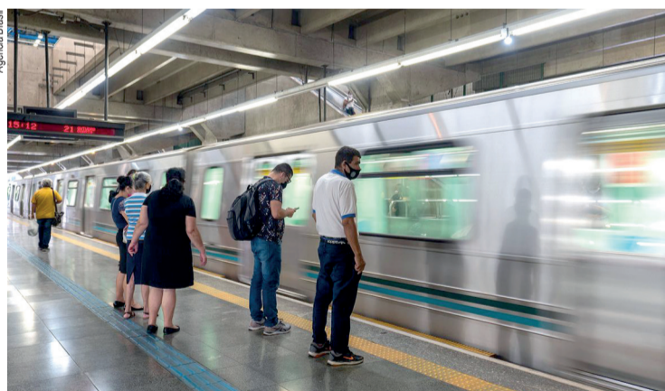
Passageiros poderão pagar com crédito e débito

A duração inicial é de seis meses, com possibilidade de prorrogação. Busca-se avaliar a aceitação dos passageiros e ajustes que possam ser feitos. "A novidade traz como principais benefícios aos passageiros a rapidez no embarque, já que o pagamento acontece em segundos", informa o Metrô.