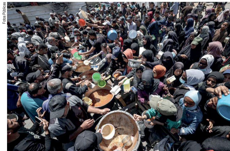
Em Gaza, desnutrição atingiu níveis alarmantes

O secretário-geral das Nações Unidas frisou que a fome nunca deve ser usada como arma de guerra, em uma referência, em particular, aos conflitos em curso em Gaza e no Sudão. “Os conflitos continuam propagando a fome em Gaza, no Sudão e em outros países. A fome alimenta a instabilidade e compromete a paz. Nunca devemos aceitar a fome como arma de guerra”, afirmou Guterres.