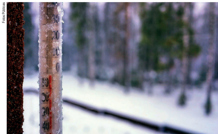
O frio extremo também alcançou o Reino Unido

Especialistas meteorológicos alertam que o ar ártico continuará colidindo com massas de ar úmido nos próximos dias, mantendo o risco de mais nevascas e prolongando o impacto sobre viagens e infraestrutura. Autoridades recomendam monitorar atualizações e adiar viagens.