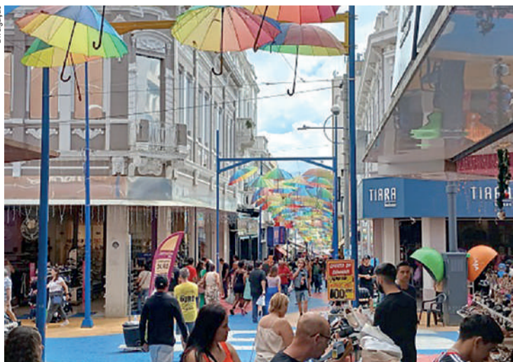
O setor de Serviços liderou a geração de empregos