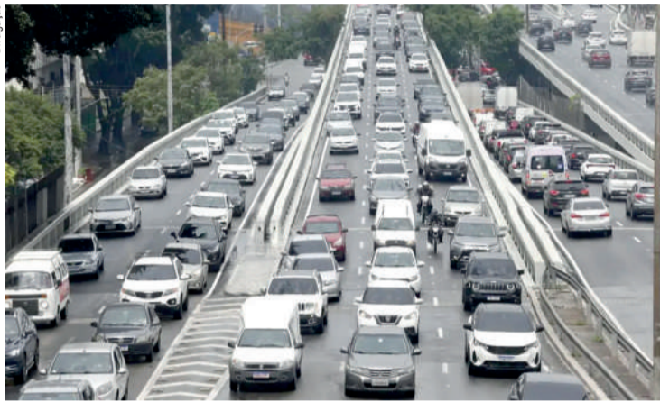
Em três meses, 5,5 milhões de veículos foram licenciados

O Detran-SP alerta que circular sem licenciamento pode resultar no recolhimento do veículo. "A pendência impede a circulação