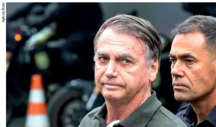
Bolsonaro foi condenado a 27 anos de prisão

Segundo a defesa, o ex-presidente apresentou quadro clínico compatível com traumatismo craniano, síncope noturna associada à queda, crise convulsiva, oscilação de memória e um corte na têmpora. Os advogados sustentaram a