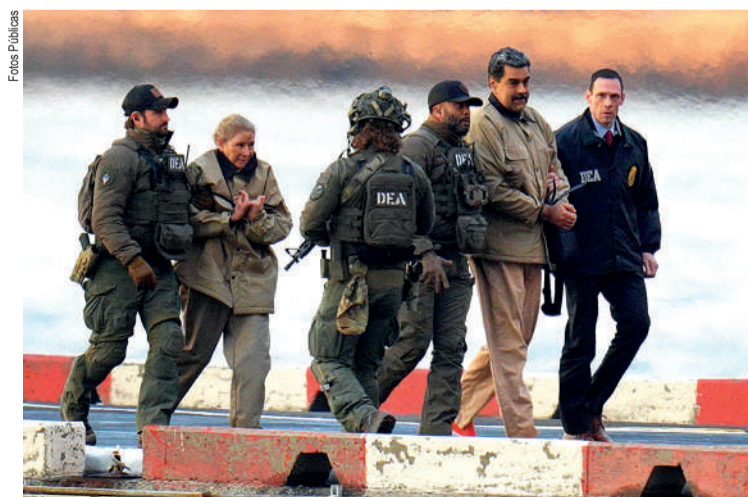
A mudança ocorre após a captura de Maduro pelos EUA