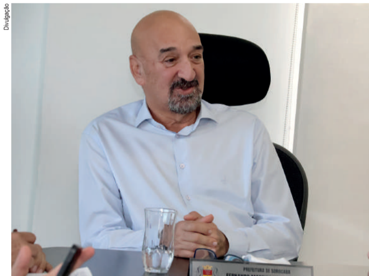
Decisão foi estratégica, diz prefeito