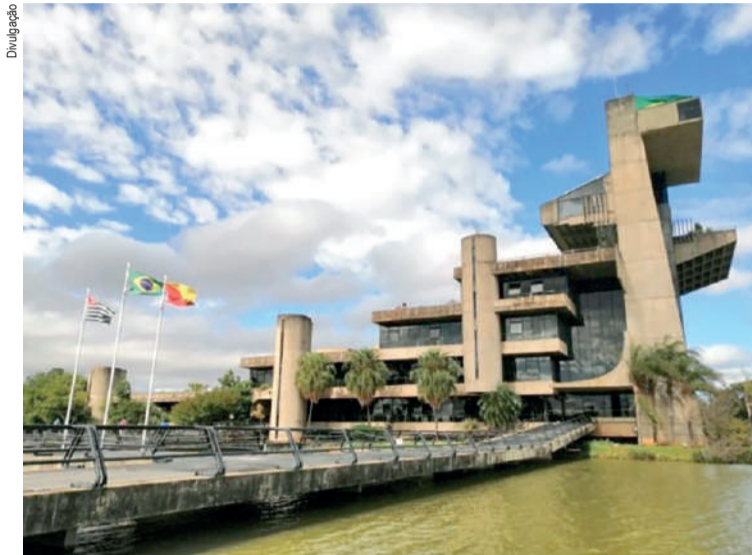
Uma nova composição do secretariado será anunciada