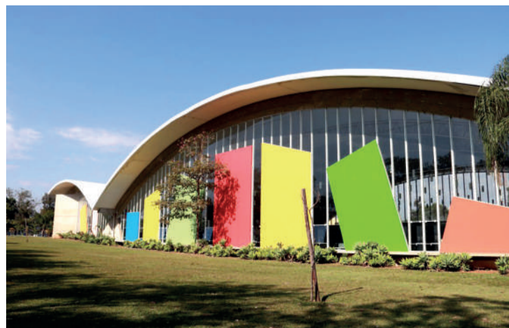
A Biblioteca Municipal fica no Alto da Boa Vista

Com proposta cultural e educativa, a oficina busca aproximar a população do acervo da biblioteca e incentivar o acesso à leitura. A iniciativa aposta em práticas artísticas e lúdicas para estimular o interesse por livros e diferentes linguagens.