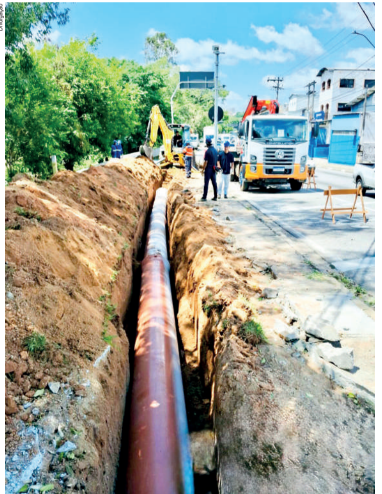
Há interdição parcial do trânsito na avenida

Durante o período das obras, há interdição parcial do trânsito na avenida. O trecho permanece sinalizado, e a previsão é de que os serviços sejam finalizados ainda neste mês de janeiro.