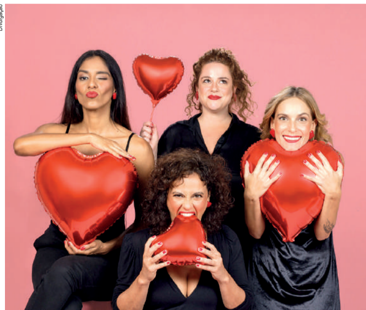
No sábado (10), tem “A rosa mais vermelha desabrocha”

No domingo (11), às 16 horas, o espetáculo infantil “Desbotou”, da Cia. da Revista, aborda diversidade e imaginação em uma narrativa poética. O encerramento acontece às 17 horas com show gratuito de Andrezé, artista de Sorocaba que transita entre hip-hop, R&B e MPB.