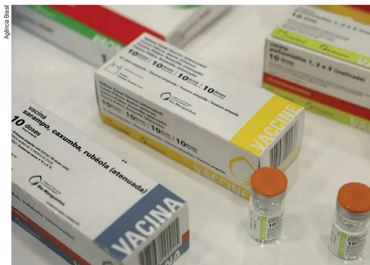
No Brasil, não há casos confirmados em 2026

No Brasil, não há casos confirmados em 2026, e o país mantém o status de livre do sarampo após 38 registros em 2025, em sua maioria importados. Especialistas alertam, porém, que o intenso fluxo internacional exige vigilância contínua e altas taxas de imunização.