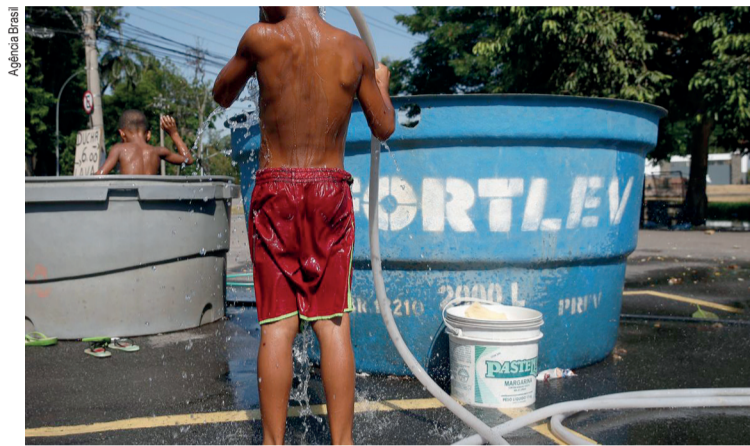
No Brasil, crianças e adolescentes convivem com calor extremo