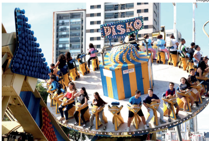
A programação terá brinquedos inéditos

A programação ocorre de quarta a sexta-feira, das 18 horas à meia-noite, e aos sábados, domingos e feriados, das 13 horas à meia-noite. A entrada será gratuita às quartas e quintas-feiras; nos demais dias, o acesso custa R$ 5. Os ingressos para setores especiais estão disponíveis no site oficial da festa.