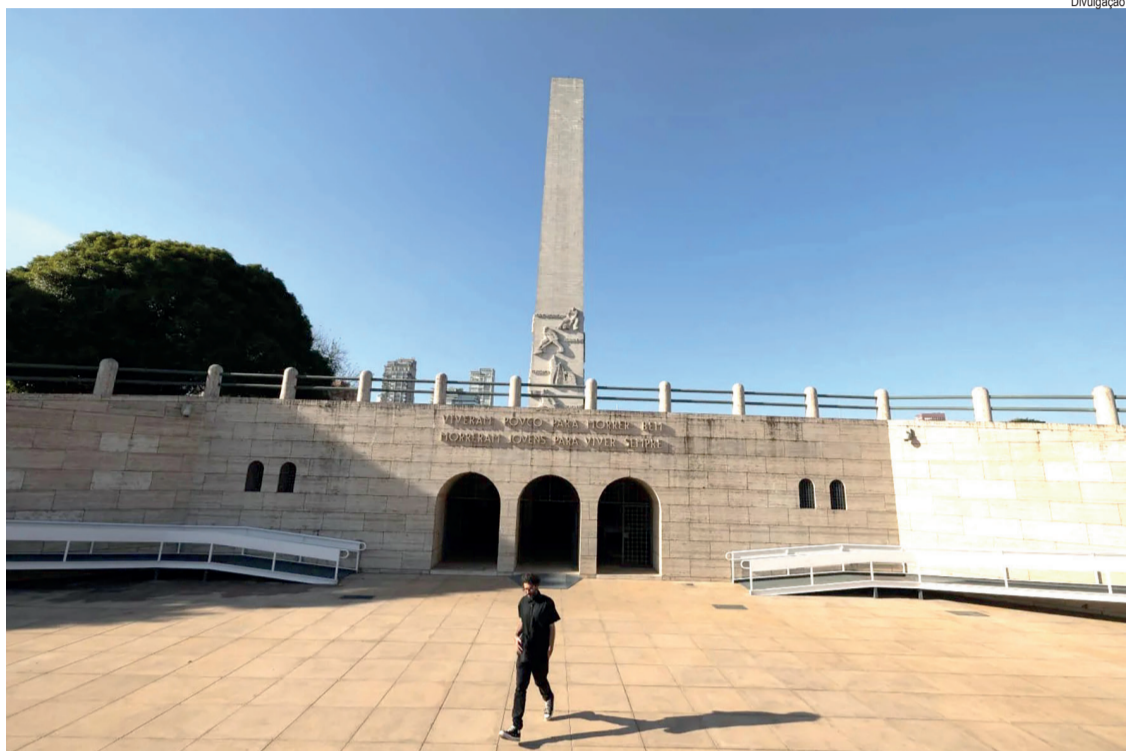
Obelisco do Ibirapuera, marco principal da Revolução de 1932

Com opções distribuídas por diferentes regiões, o roteiro oferece ao visitante uma imersão nos 87 dias de conflito. A proposta alia educação, memória e valorização do patrimônio paulista.