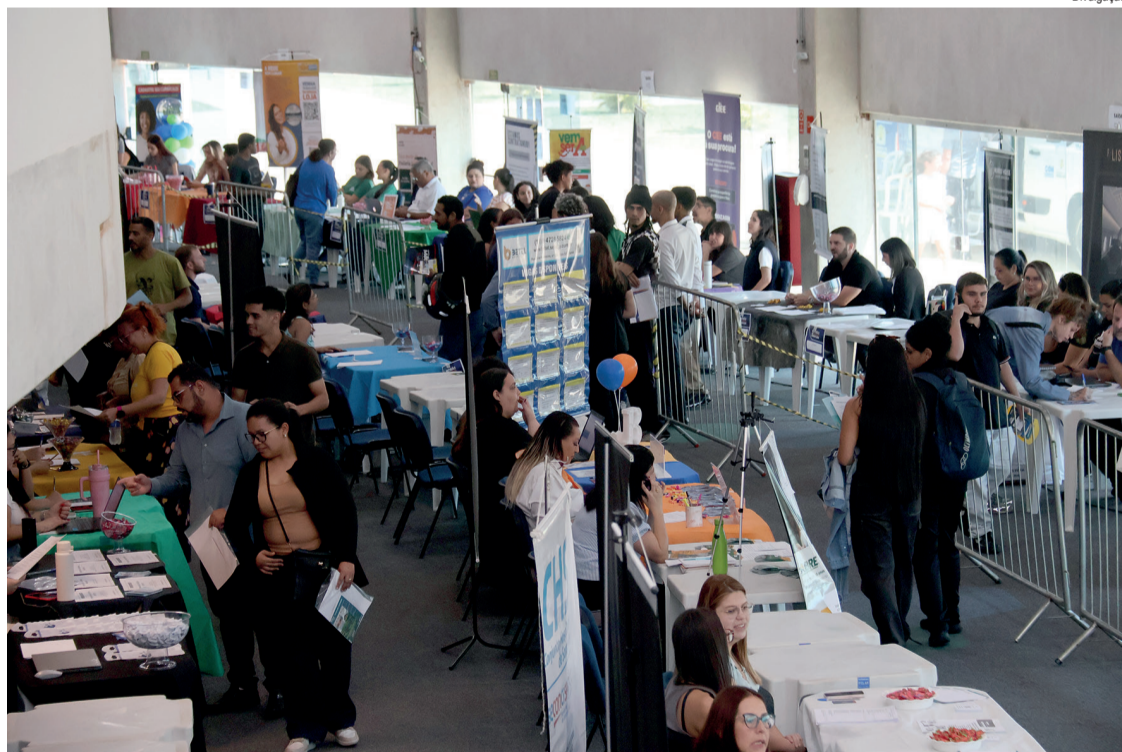
Os interessados devem comparecer ao local com currículo impresso

A Prefeitura de Sorocaba realiza, no dia 28 de julho, a 51ª edição do Mutirão de Empregos, a partir das 9 horas, no Parque Tecnológico, com oferta de vagas em diferentes setores.