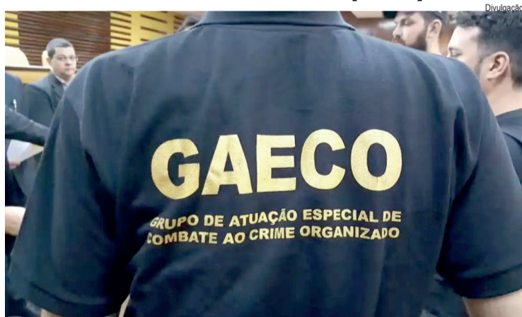
As diligências buscam reunir provas para apurar crimes

O Grupo de Atuação Especial de Combate ao Crime Organizado (Gaeco), do Ministério Público de São Paulo, realizou nesta terça-feira (7) uma operação para investigar um esquema de fraude em licitações na capital. A ação cumpre mandados de busca em endereços ligados aos suspeitos.